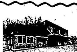
本社入口の坂を 登っていただくと 直売所がございます