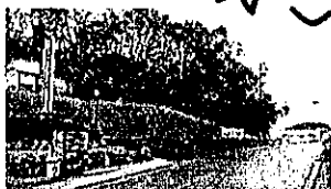
花瀬の交差点から 西伊岐須に向かう 途中左手の看板が目印です